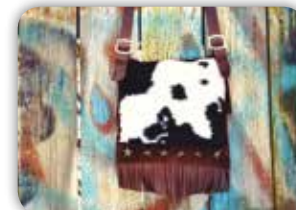
RECYKLOVANÁ KABELKA VE STYLU DIVOKÉHO ZÁPADU 20