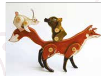
Ateliér A2Z v sérii DŘEVO dětem vrací všechna „skupenství tohoto nádherného materiálu“ ve formě autorských designových dekorací, objektů, loutek a her – nejen pro děti / www.fler.cz/ateliera2z