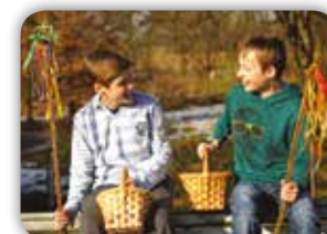
TRADIČNÍ POMLÁZKA Z VRBOVÉHO PROUTÍ 30