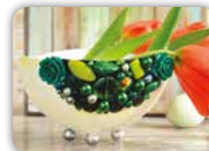
MISKA NA NOŽKÁCH S KORÁLKOVOU APLIKACÍ 22