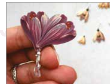
Ručně malované motivy na šperky, zrcátka, nažehlovačky, deníčky – Klára Kubešová / www.fler.cz/amelka